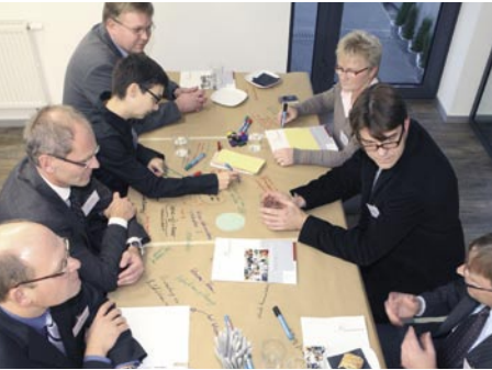
World-Café bei Wissen live!