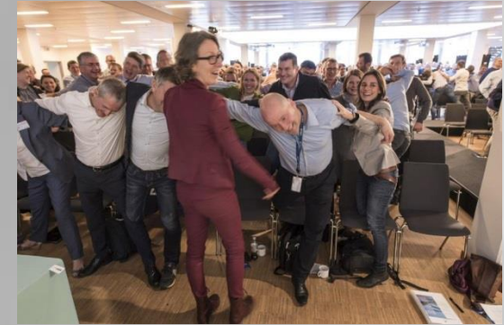
Waking up the participants