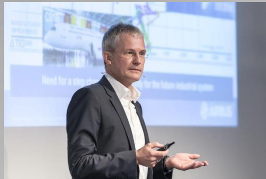
Keynote speakers introducing into time to market