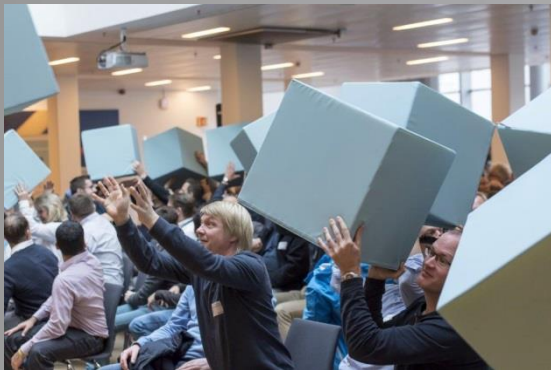
Cubes are being passed from back to front