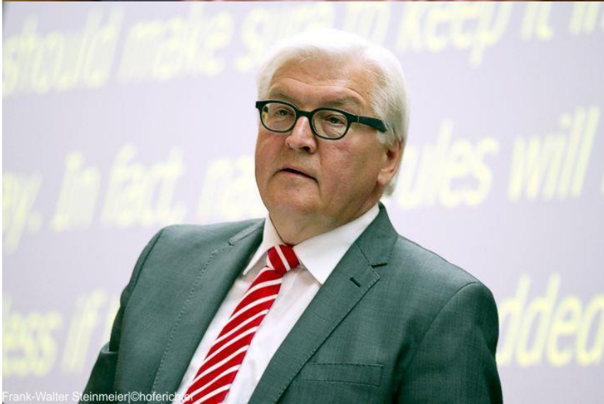
Frank-Walter Steinmeier