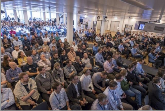
Full House – our ceremony room filled to capacity