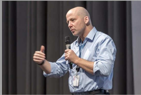
Introduction into the rules of the day