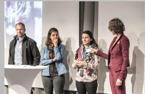
Volunteers for the “prototypes”